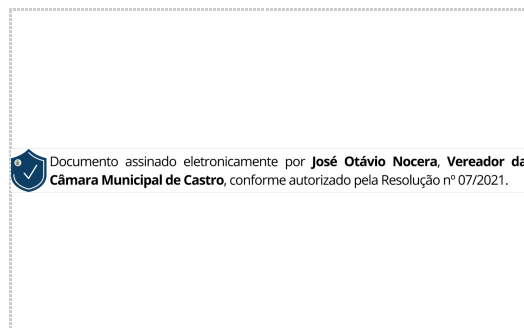
Assinatura de José Nocera

Pontos de autenticação: Assinatura na tela IP: 177.51.86.243 Dispositivo: Mozilla/5.0 (iPhone; CPU iPhone OS 15_5 like Mac OS X) AppleWebKit/605.1.15 (KHTML, like Gecko) GSA/281.0.563599851 Mobile/15E148 Safari/604.1 Data e hora: Setembro 19, 2023, 15:43:46 E-mail: zenocera@castro.pr.leg.br Telefone: + 554232338513 ZapSign Token: 9399fc9b-****-****-****-c56dee5c9e53