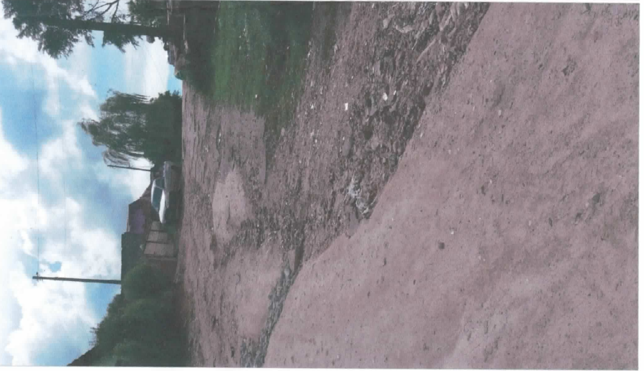
Rua: Acelino Correa