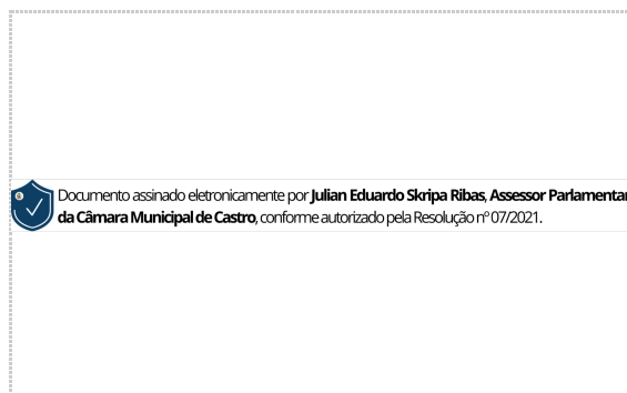
Assinatura de Paulinho Farias

Pontos de autenticação: Assinatura na tela IP: 179.189.26.169 / Geolocalização: -24.796834, -50.006405 Dispositivo: Mozilla/5.0 (Windows NT 10.0; Win64; x64) AppleWebKit/537.36 (KHTML, like Gecko) Chrome/119.0.0.0 Safari/537.36 Data e hora: Novembro 10, 2023, 16:44:03 E-mail: julian.ribas@castro.pr.leg.br ZapSign Token: 401b2b18-****-****-****-049c261be6a1