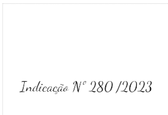
Assinatura de Indicação nº 280 /2023

Pontos de autenticação: Assinatura na tela Código enviado por e-mail IP: 179.189.26.169 / Geolocalização: -24.790294, -49.987984 Dispositivo: Mozilla/5.0 (Windows NT 10.0; Win64; x64) AppleWebKit/537.36 (KHTML, like Gecko) Chrome/109.0.0.0 Safari/537.36 Data e hora: Dezembro 11, 2023, 14:42:14 E-mail: recepcao@castro.pr.leg.br (autenticado com código único enviado exclusivamente a este e-mail) ZapSign Token: af4fb3ca-****-****-****-c37dc619e872