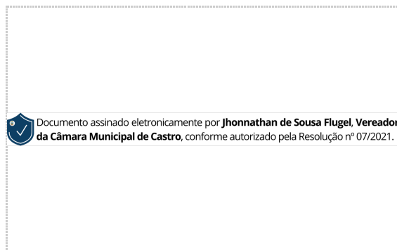
Assinatura de Jhonnathan Flugel

Pontos de autenticação: Assinatura na tela IP: 179.189.26.169 Dispositivo: Mozilla/5.0 (Windows NT 10.0; Win64; x64) AppleWebKit/537.36 (KHTML, like Gecko) Chrome/109.0.0.0 Safari/537.36 Data e hora: Dezembro 13, 2023, 14:50:03 E-mail: jflugel@castro.pr.leg.br ZapSign Token: cba54956-****-****-****-e92e3844390e