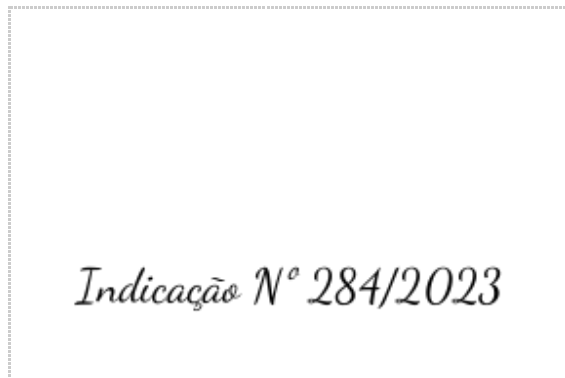
Assinatura de Indicação nº 284/2023

Pontos de autenticação: Assinatura na tela Código enviado por e-mail IP: 179.189.26.169 / Geolocalização: -24.793046, -49.991712 Dispositivo: Mozilla/5.0 (Windows NT 10.0; Win64; x64) AppleWebKit/537.36 (KHTML, like Gecko) Chrome/109.0.0.0 Safari/537.36 Data e hora: Dezembro 13, 2023, 15:13:54 E-mail: recepcao@castro.pr.leg.br (autenticado com código único enviado exclusivamente a este e-mail) ZapSign Token: 35db0e7f-****-****-****-27b10312d341