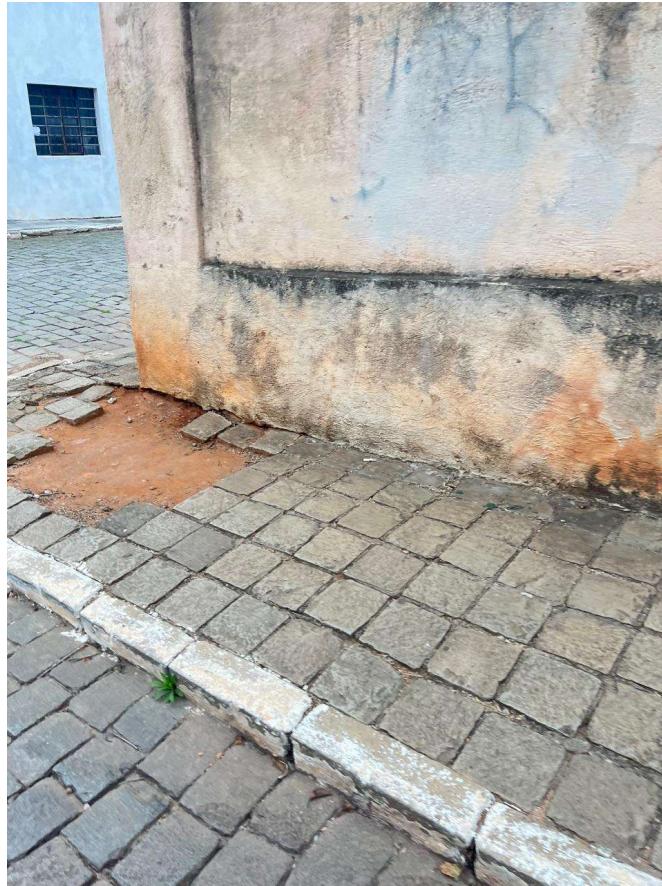
FOTO DO LOCAL

Sala das Sessões da Câmara Municipal, em 13 de maio de 2024.